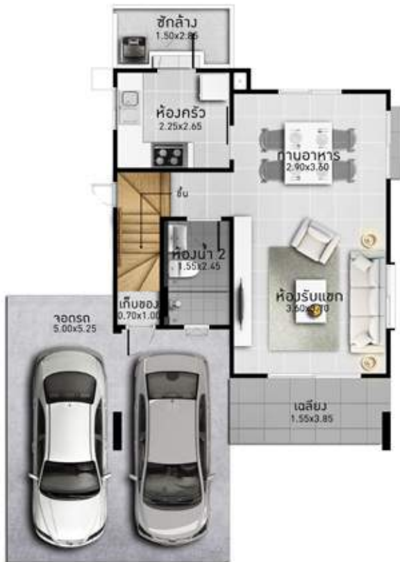
1 st floor