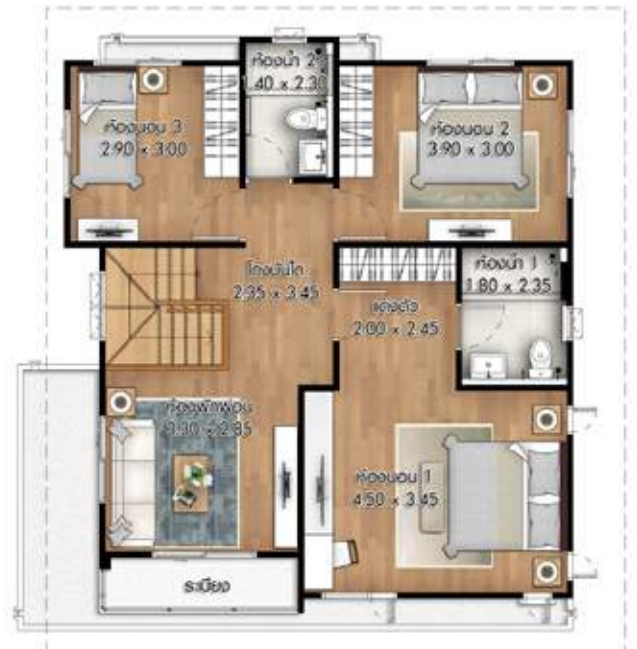
2 nd floor