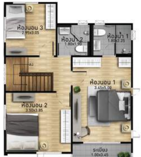
2 nd floor