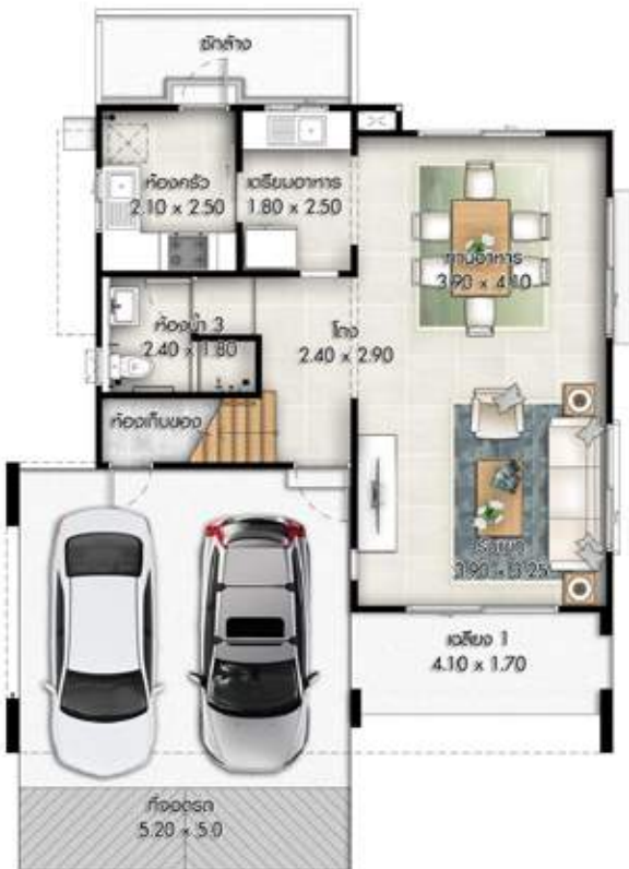
1 st floor