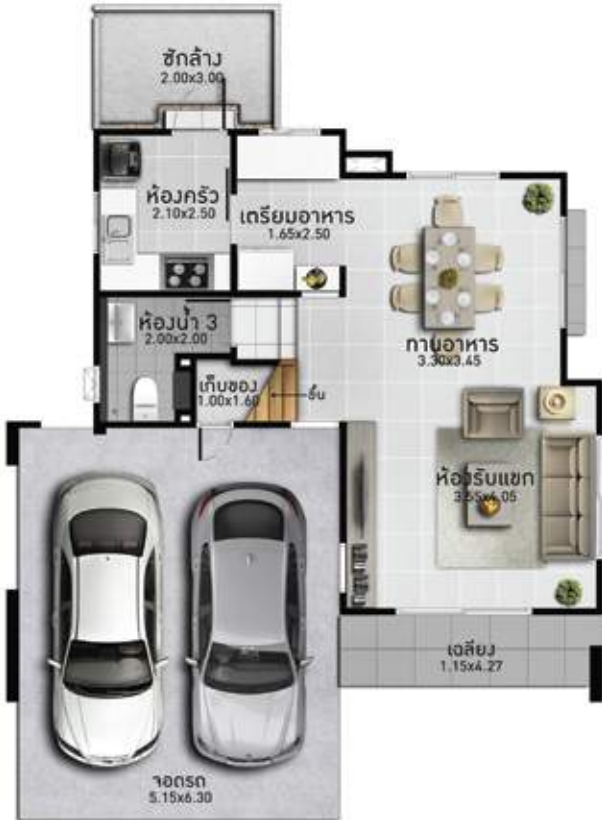
1 st floor