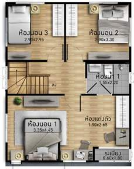
2 nd floor